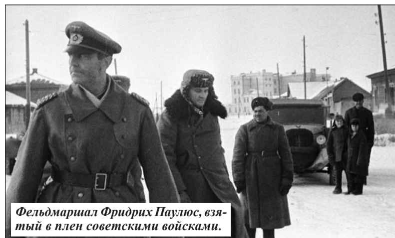
Фельдмаршал Фридрих Паулюс, взятый в плен советскими войсками.